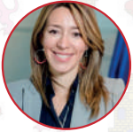
Xiana Méndez State Secretary for Trade MINISTRY OF INDUSTRY, COMMERCE AND TOURISM, SPAIN